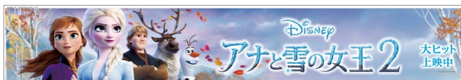
人気キャラクターが集結した窓下のラッピングデザイン（上） とエルサのせりふ入りのドア横のラッピングデザイン（右）